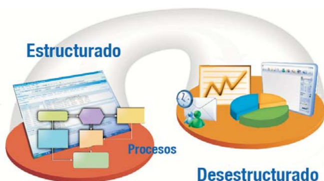
Figura 2. Portales de Negocio enfocados a las necesidades del cliente, conectando el trabajo estructurado con el no-estructurado.

Constituye por tanto una gran ventana de información, un centro neurálgico donde acceder a documentos y aplicaciones e interactuar con otros, agilizándose así la toma de decisiones empresariales.