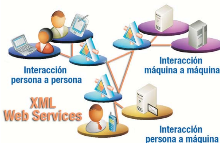
Figura 3. Usuarios conectados